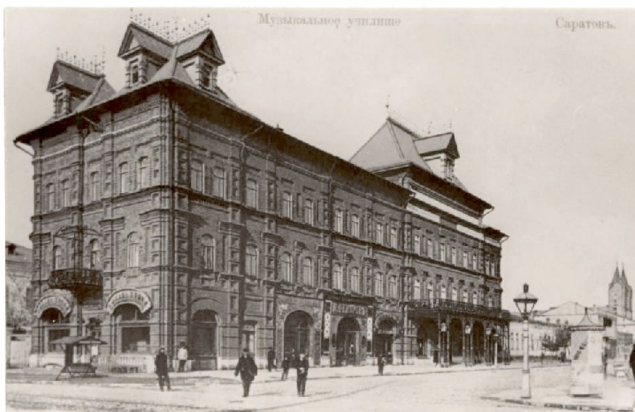
Музыкальное училище (ныне консерватория)

Это цитата из отчёта в "Саратовском листке" о вечере нового искусства в музыкальном училище, одним из участников которого был Бальмонт. Он завершался фразой: "Сбор был огромный". Это свидетельствовало о том, что мнения рецензента и публики существенно различались.