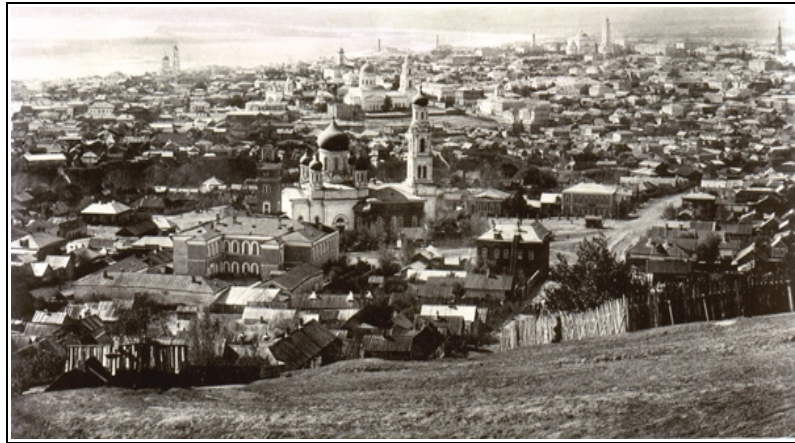
Псковск. 20-е годы