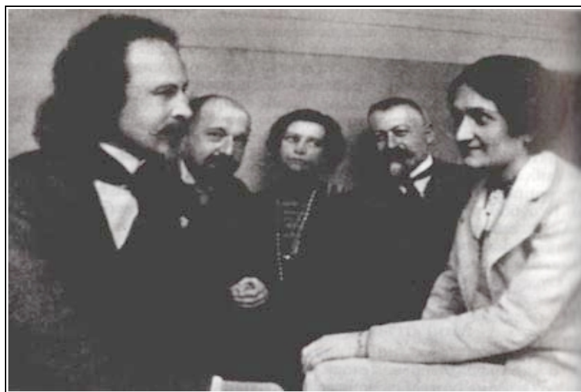
К. Бальмонт в кругу читателей

"Я очень-очень обласкан Саратовом. После ярославских глупцов и нижегородских дураков (я был кроток и с теми и с другими) Казань и Саратов – два ярких пятна, два розовых цветника в саду)". А в письме организатору вечера Бальмонта М.Букинику поэт признаётся: "Те сутки, которые я провёл в Саратове, были для меня настоящим праздником. Я видел людей, которые внимательны, умны и полны искреннего интереса к искусству. Саратовская публика, на мой взгляд, гораздо привлекательнее московской" .